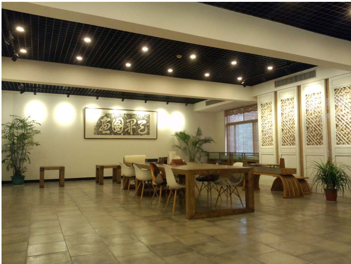
中心大厅研讨展览区之一