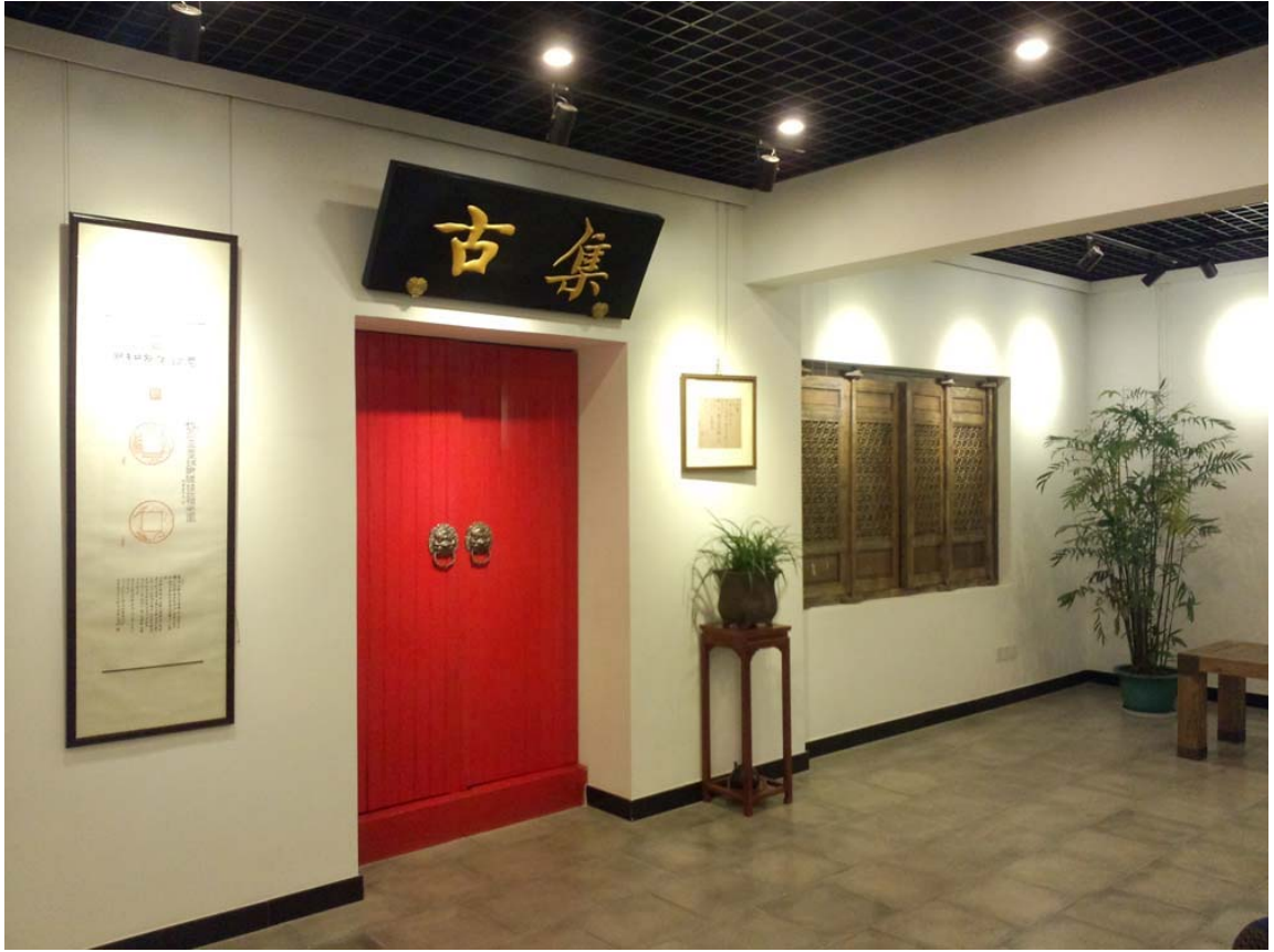
中心大厅研讨展览区之三