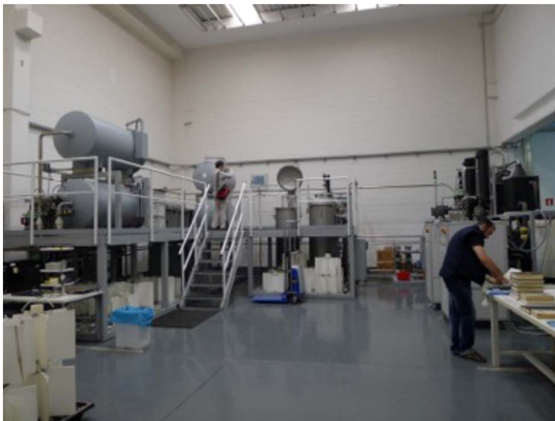
在其他国家使用的 PTLP 公司的全套脱酸设备（用于小幅面单页或图书脱酸）