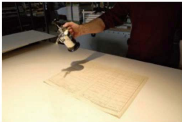
PTLP 公司喷雾脱酸设备（用于大幅面纸张脱酸）