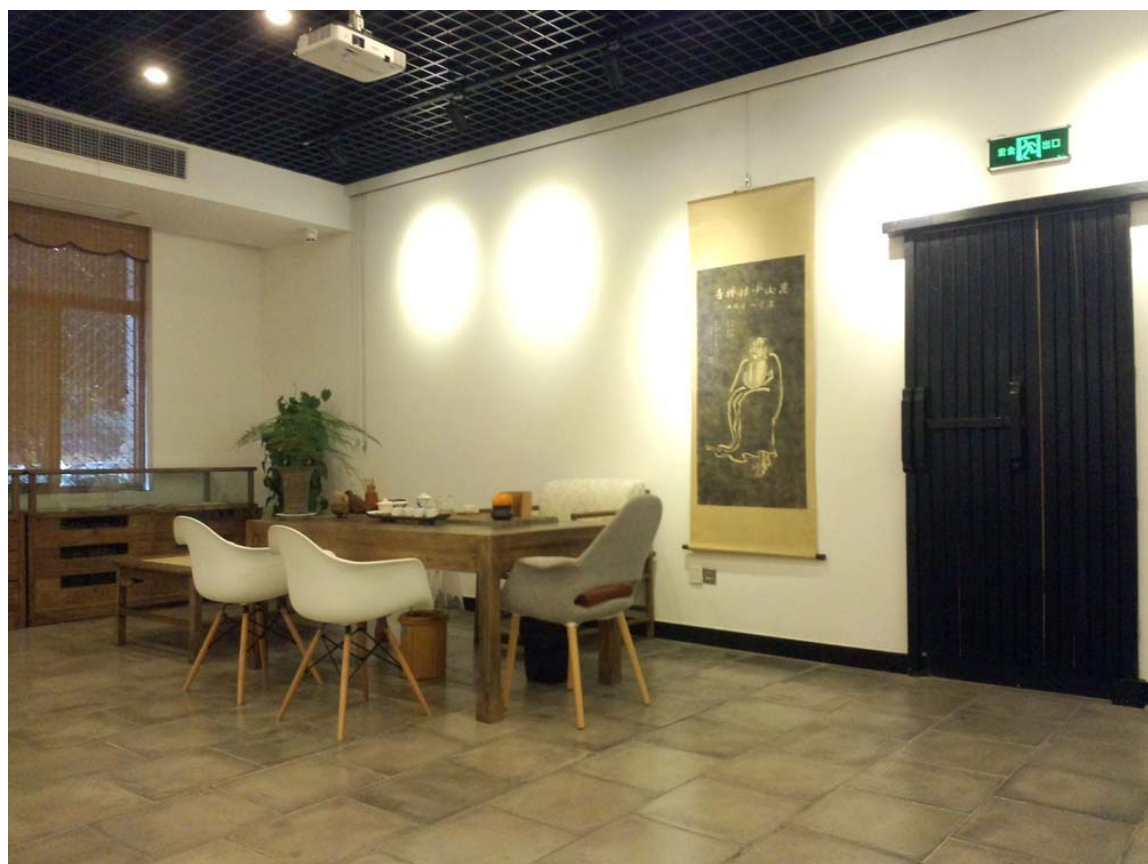
中心大厅研讨展览区之二