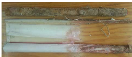
完全霉烂/部分霉烂