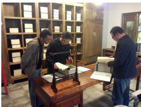
张曦书记（中）翻阅中心藏书

碑帖中心于 2013 年 4 月由图书与信息中心发文成立。2014 年中心利用图书馆的一个 200 平方米的场地装修完成并进行了试运行。试运行期间，中心已经开展了一系列的工作：如在图书馆的支持下，购买了第三批约 2500 余张墓志拓片；不断推进“中国历代墓志数据库”的建设；与南京维米斯公司古籍脱酸及修复合作；出版了《浙江大学国家珍贵古籍名录图录》；进行了中心资料库的建设，并与图书馆学术特藏“金石碑帖特藏”合署。中心也于此期间接待了原浙江大学党委书记张曦同志、中国社科院吕大年研究员、杭州市富阳区委书记姜军等专家学者，也有相关书法界人士如郭牧、李登智等的到访，并为中心留下墨宝。