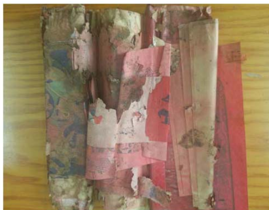
浸水后霉烂及褪色严重